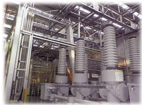
タンク形ガス複合開閉装置 (GCS.66~120kV)